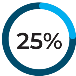
Crecimiento sector Fintech

No asesoramos sobre “implementar tecnología”, sino sobre integrar el sistema nervioso central de las corporaciones modernas.